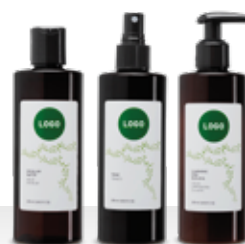
línea LIMPIEZA FACIAL