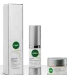
línea OJOS y LABIOS